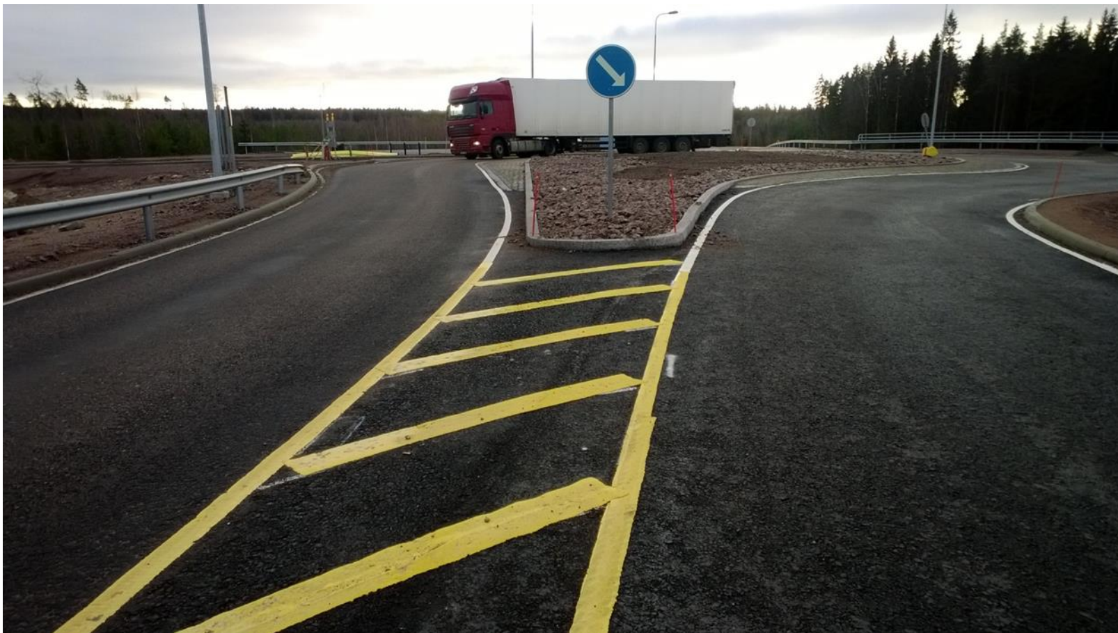
Vägmarkeringar på nya E18 mellan Helsingfors-Kotka, en "droppe"anslutning