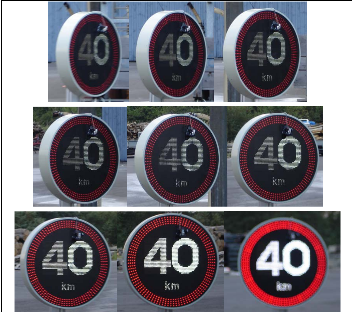
Figur A.4 Bildserie som visar hur vidvinkelighet och färg förändras vid förflyttning sidledes mot skylten i steg om cirka en meter. Observera att detta är ett exempel och gäller för just denna skylt.