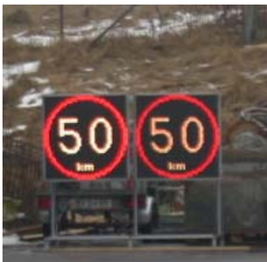
Figur 1 VMS som användes vid observationerna 2006. S1 till vänster och S2 till höger.

Valfri symbol kunde visas på skyltarna och i försöket användes symbolen "50 km". Lysdioderna var vita eller gulaktiga (beroende på luminans) och tavlan hade en röd bård, se figur 1. Fortsättningsvis kommer den vänstra skylten att benämnas S1 och den högra S2.