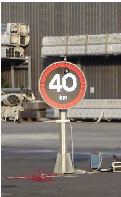
Figur A.2 Försöksupställning i medsol.

Observationer gjordes även i mulet väder i medljus, där solens altitud var cirka 13°. Resultatet från dessa visade att vid belysningsstyrkor mellan 3 000 och 12 000 lux på skyltens framsida föredrogs luminansklass L3 eller högre.