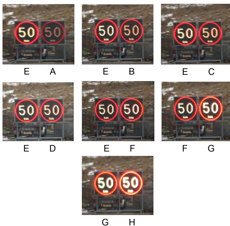
Figur 3 De sju kombinationer av luminansnivåer för vilka bedömningar gjordes.

Resultaten i tabell 3 visar att luminansnivå G bedömdes vara den "mest lämpliga". Detta innebär att den optimala luminansen för tänd skylt är LT \approx 6\,000 \text{ cd/m}^2 vid dagsljusnivån EV \approx 1\,700 \text{ lx} . Detta motsvarar att skylten måste tillhöra luminansklass L3 och att den "mest lämpliga" luminansen är ungefär lika med den maximalt tillåtna nivån.