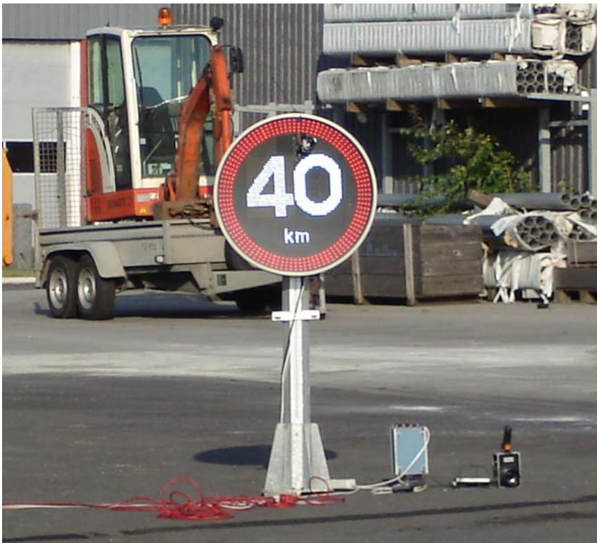
Figur A.1 VMS som användes vid observationerna i september 2006.

En VMS-skylt lånades av företaget Olsen Engineering i Danmark. Denna visade symbolen "40 km" och kunde varieras i luminans upp till maximalt 22 000 cd/m 2 . Tavlan hade vit symbol med svart bakgrund och röd bård, se Figur A.1. Försöken utfördes på Frederiksborg Amts materialgård i Hillerød.