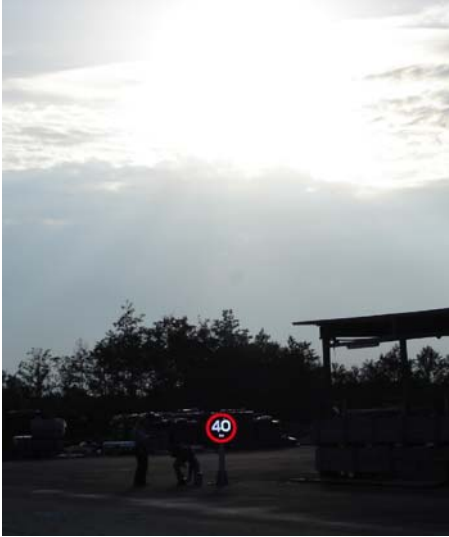
Figur A.3 Försökupställning i motsol.

Observationer gjordes även i mulet väder i motljus vid solens altitud cirka 11^\circ . Dessa observationer visade att luminansklass L3 var tillräcklig vid omkring 1 500 lux på skyltens framsida.