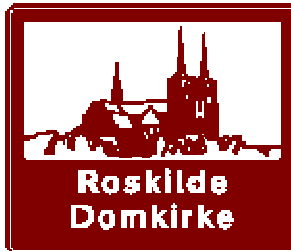
K 30 Turistoplysningstavle