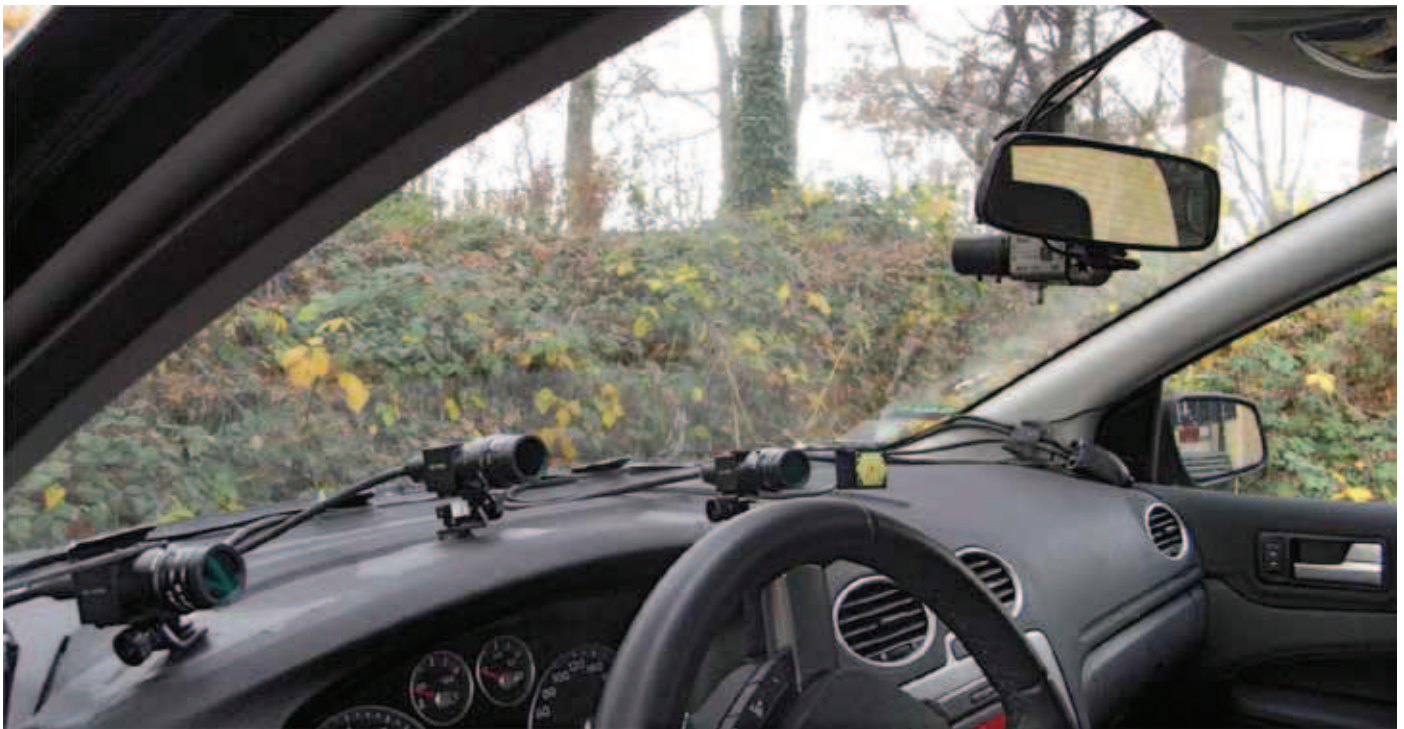
Figur 2. Målebilen er udstyret med et eyetracking system, der under kørslen registrerer, hvad bilistens blik er rettet mod. Udstyret består bl.a. af tre små infrarøde kameraer placeret på instrumentbrættet samt et scenekamera, der videofilmer ud af forruden.

ringsprogram, som bestående af fire dele: