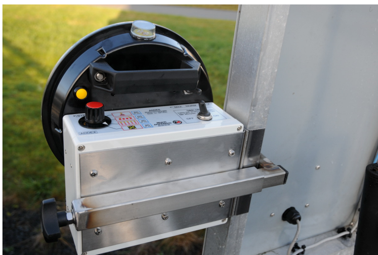
Referencelampe monteret på tavlevogn.